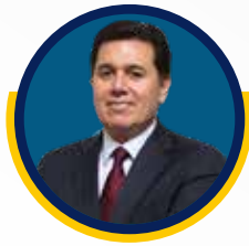
Mtro. Renato Bartet Secretario Ejecutivo de la Comisión Nacional de Acreditación ( CNA ), en Chile.